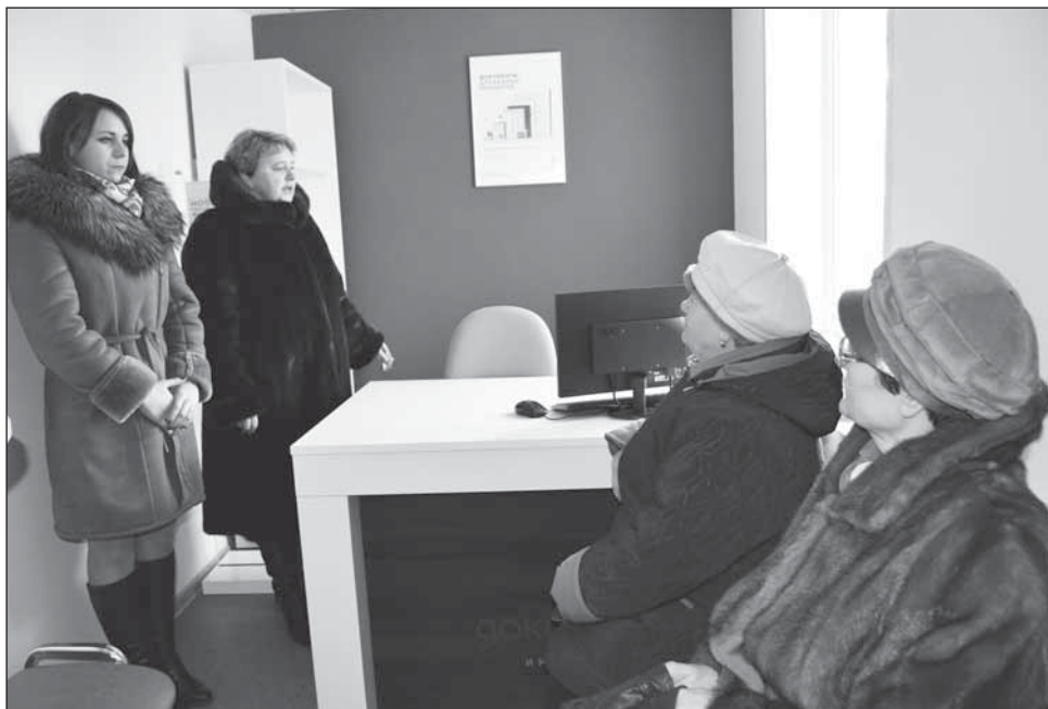
■ Вопросы можно было задать на месте