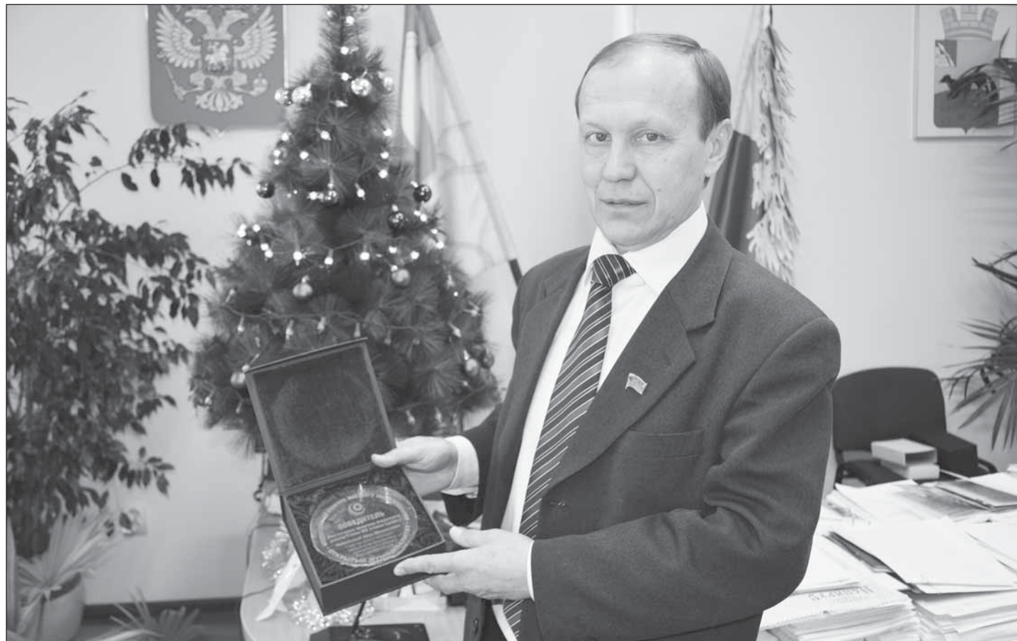
■ Приятно было получить награду в предновогодние праздники