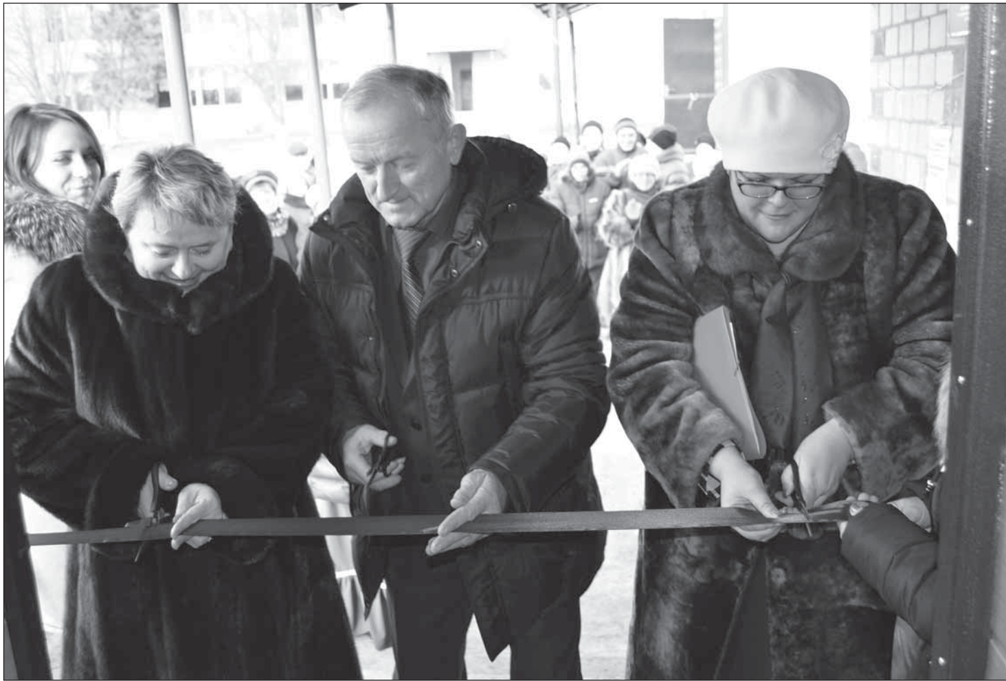
■ Торжественный момент открытия офиса

– А заграничный паспорт можно будет сделать?